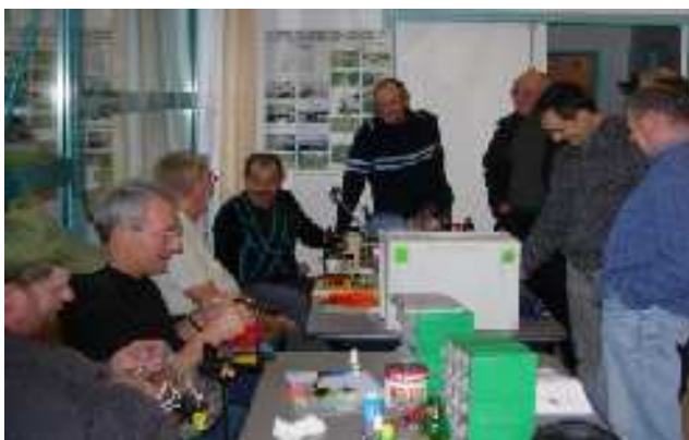
9 novembre, portes ouvertes