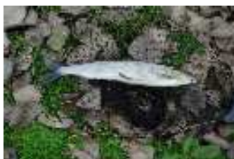
24 octobre sortie OMBRES