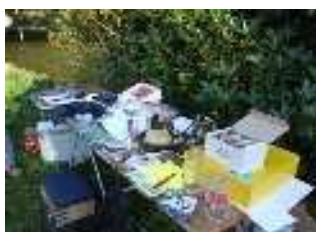
27 septembre, les lots du concours de pêche