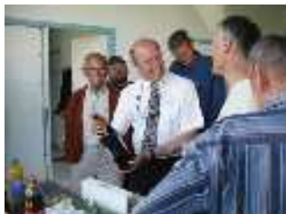
En juin, les départs de notre Secrétaire et de notre Trésorier