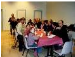
9 janvier – la galette des rois